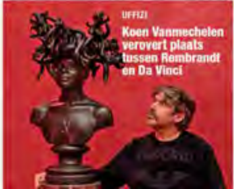
UFFIZI Koen Vanmechelen veroverd plaats tussen Rembrandt en Da Vinci

Vanmechelen's 'Seduzione' exhibition at the Uffizi in Florence is a mix of classical and modern art. It features works by Caravaggio, Bernini, Michelangelo, and Rodin, along with Vanmechelen's own sculptures and paintings. The exhibition is a provocative statement, placing the art in a new context. It is a challenge to the museum and the audience. It is a way for the art to speak for itself and not be influenced by the way it is presented.