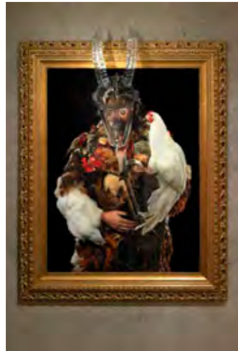
Ubuntu © Koen Vanmechelen

The work is entitled 'Ubuntu' which means: "I am, because we are". The concept lies at the heart of the philosophy of the South-African Bantu people. It is based on giving and taking and on the universal bond of sharing that connects all humanity: we are there for each other. Biologically and socially we are nothing without others. For the Bantu people this philosophy implies humanity, universality and openness.