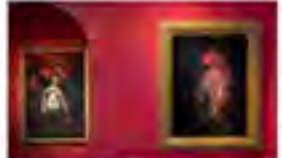
Vanmechelen's 'Seduzione' exhibition at the Uffizi in Florence, featuring works by Caravaggio and Bernini.

Vanmechelen wil 'Seduzione' niet alleen in het Uffizi laten zien, maar ook in andere musea. Hij heeft al tentoonstellingen gehad in het Louvre in Parijs en het Prado in Madrid. Hij wil graag weten hoe de kunst wordt ontvangen in andere landen. Hij vindt het belangrijk om de kunst te laten spreken voor zichzelf en niet te worden beïnvloed door de manier waarop ze wordt gepresenteerd.