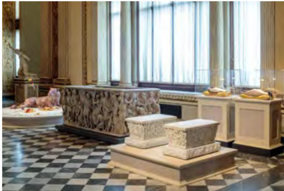
Installation view, Seduzione, Koen Vanmechelen, Uffizi Galleries