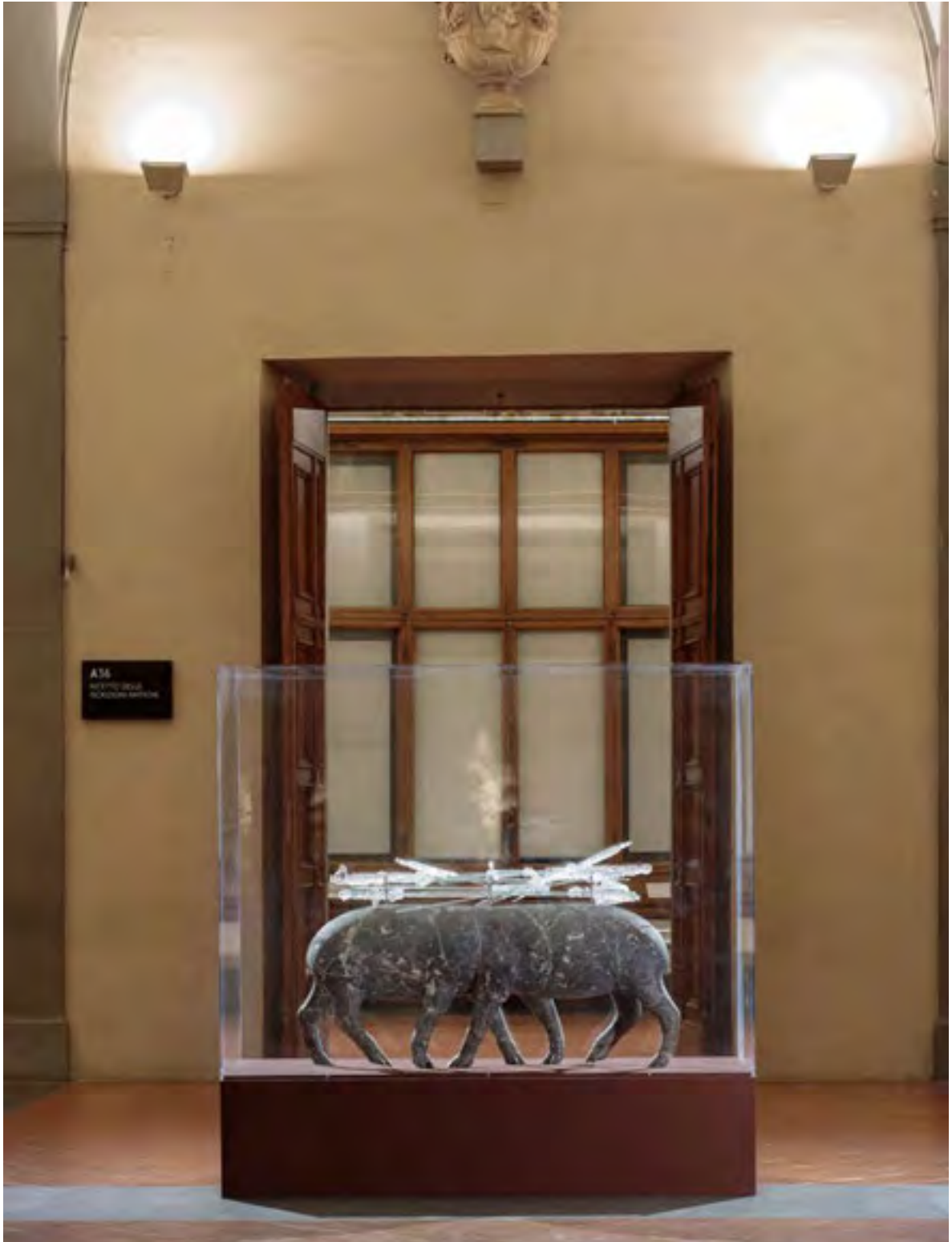
Installation view, In times of trouble, Seduzione. Koen Vanmechelen, Uffizi Galleries