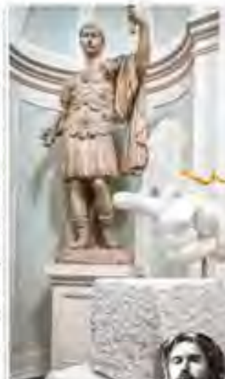
Statue van een figuur die een staf vasthoudt, mogelijk een detail van een van de werken van Vanmechelen.

De tentoonstelling wordt georganiseerd door de Uffizi en de Uffizi Gallery. Het is een unieke gelegenheid om de kunst van Vanmechelen te zien in Florence. De tentoonstelling wordt geopend op maandag 15 oktober. Het is een unieke gelegenheid om de kunst van Vanmechelen te zien in Florence. De tentoonstelling wordt geopend op maandag 15 oktober.