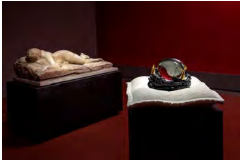
Installation view, Carried by Generations and the Sleeping Hermaphroditus, Seduzione, Uffizi Galleries

A transparent egg cradled by a nest of chicken feet. Filled with the hopeful promise of an unknowable future: what will hatch from the egg? Invisibly sculpted by previous generations, keepers of history through their genetic code: the next generation is ready to flourish. It is supported by a cushion. Who looks outside, dreams; who looks inside, awakes. The pillow is a metaphor for dream and sleep, vital processes that allow people to discover new worlds and to break boundaries