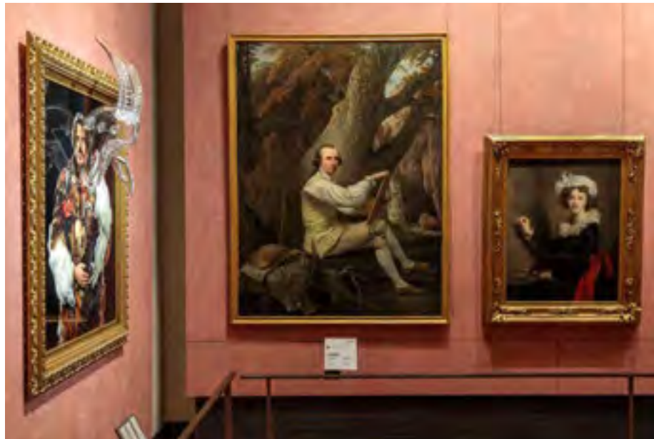
Installation view, Ubuntu, Seduzione, Koen Vanmechelen, Uffizi Galleries

This artwork will remain at Uffizi Gallerie as a permanent part of the collection.