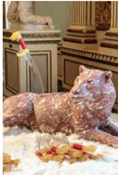
Domestic Violence, detail

A tiger lies motionless on a tapestry of chicken feathers, like a kitten on a mat. She is unaware of the threat surrounding her. Swords attack her, but they are transparent and invisible. The tiger is strong enough for now to deal with that threat and survive. But for how long? This installation is pregnant with symbolism and contradictions. The predator has become the prey. Hence the chicken relics below her, the human artifacts around her. The tiger has become a commodity. She balances on the border of existence; her survival is in the balance. As is the case with beleaguered nature, it will only spring into action when the need is there, when the threat becomes too real. This installation depicts how violent humans interact with the world and our fellow creatures. The violence we exert on all other life on this planet only becomes visible when nature fights back, as is currently happening. Domestic Violence conveys how we're destroying what's left of our beautiful world in our haste to turn it all into a commodity.