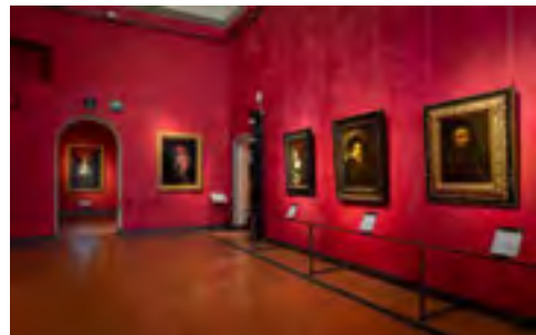
Vesta © Koen Vanmechelen