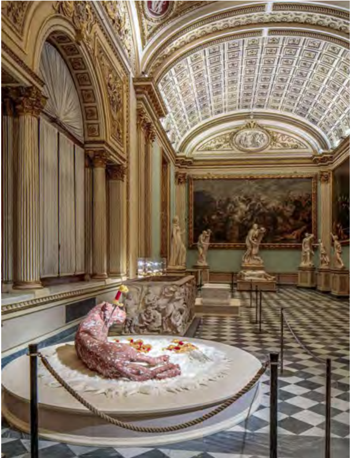
Installation view, Domestic Giant, Seduzione. Koen Vanmechelen, Uffizi Galleries