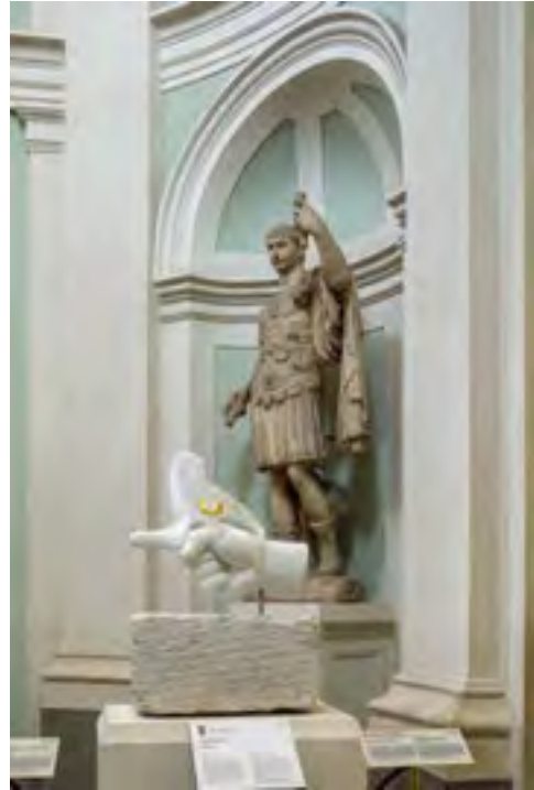
Connection © Koen Vanmechelen

This artwork is installed in the entrance hallway and directs the visitors to the rest of the exhibition.