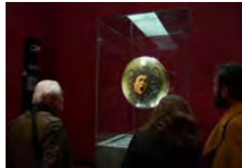
Black Medusa © Koen Vanmechelen