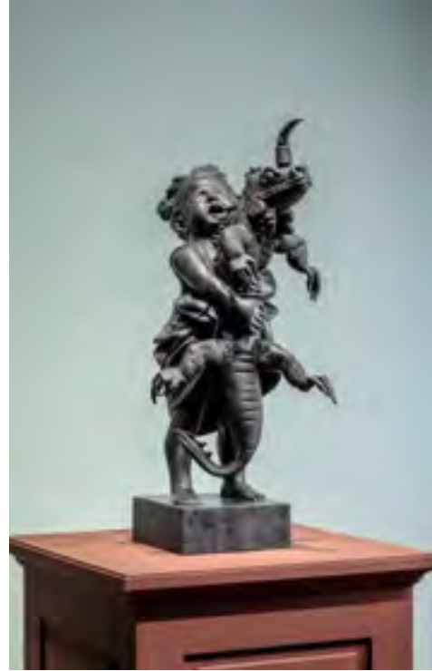
Bambino con il gallo, Adriano Cecioni