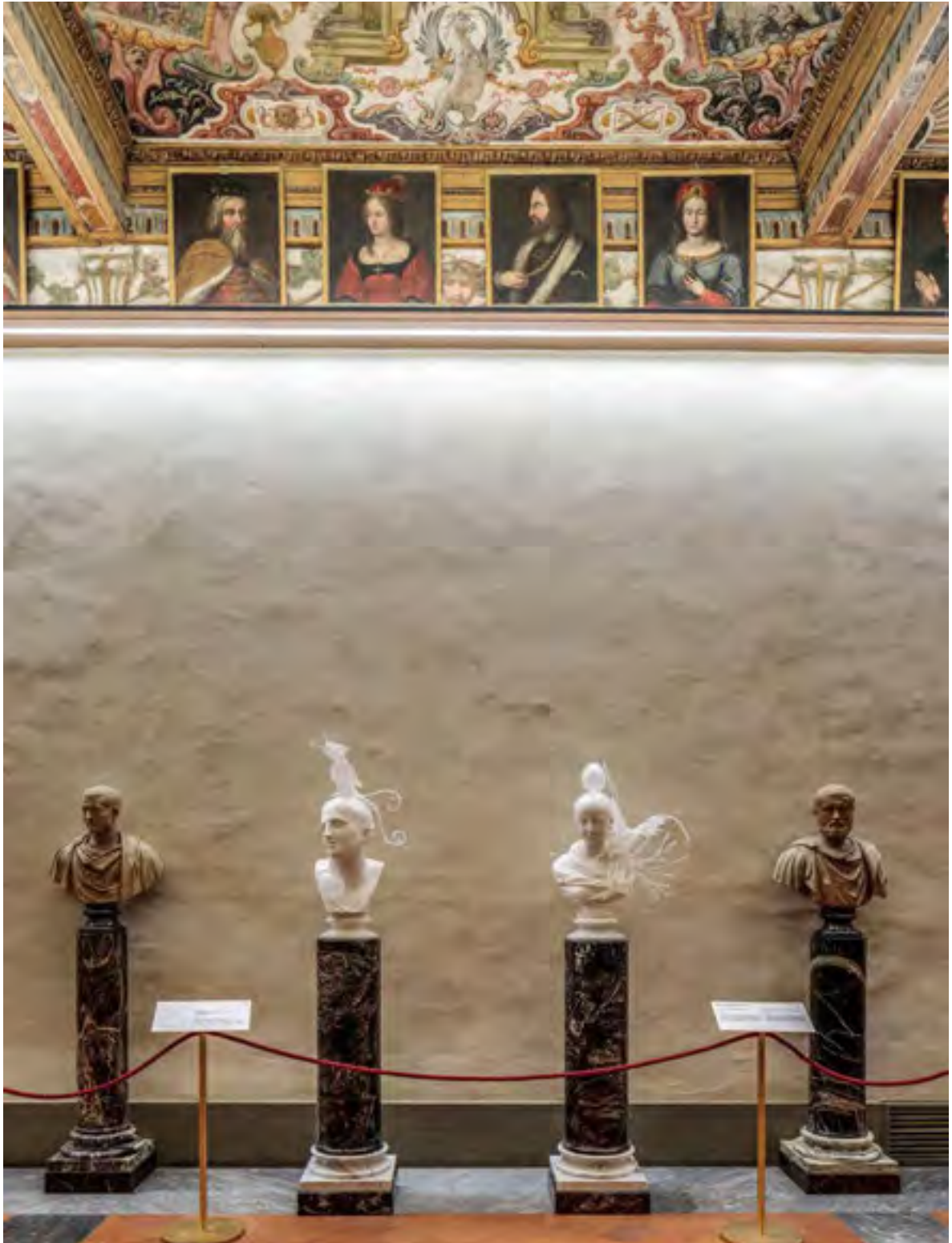
Installation view, Temptation, Seduzione. Koen Vanmechelen, Uffizi Galleries