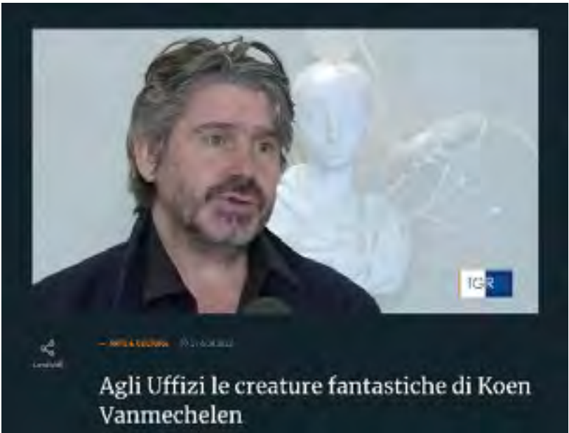
Agli Uffizi le creature fantastiche di Koen Vanmechelen