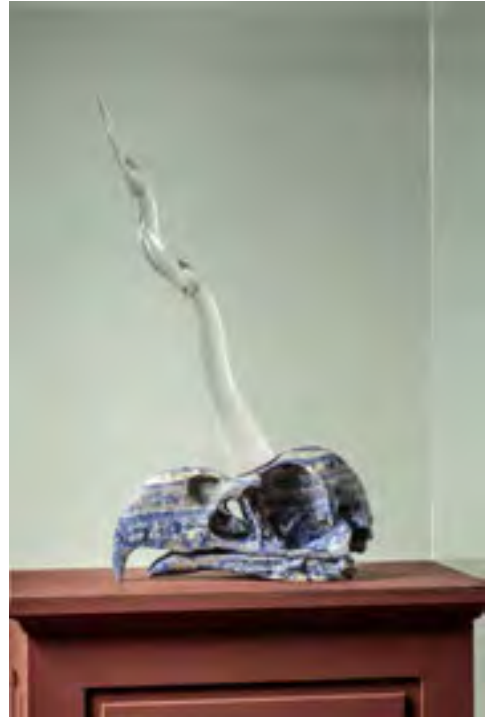
Breakthrough © Koen Vanmechelen

Out of an enlarged eagle skull, a transparent horn reaches for the sky. It represents an invisible unicorn and leads to another world. Even if only the fossil remains, after death overtook its owner, the energy keeps on being transmitted. There is always hope to break through reality and reach another world.