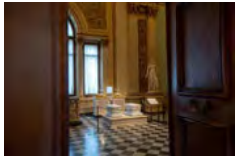
Daughter of Niobe bent by terror